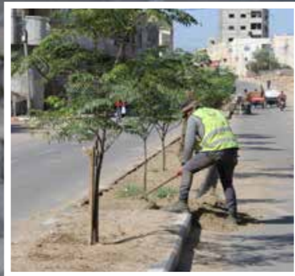
ترحيل الرمال من شوارع المدينة