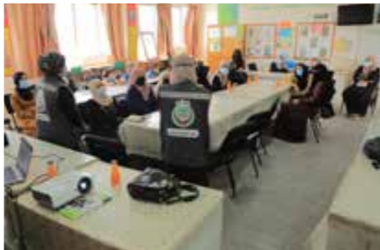
ورش عمل توعية إرشادية